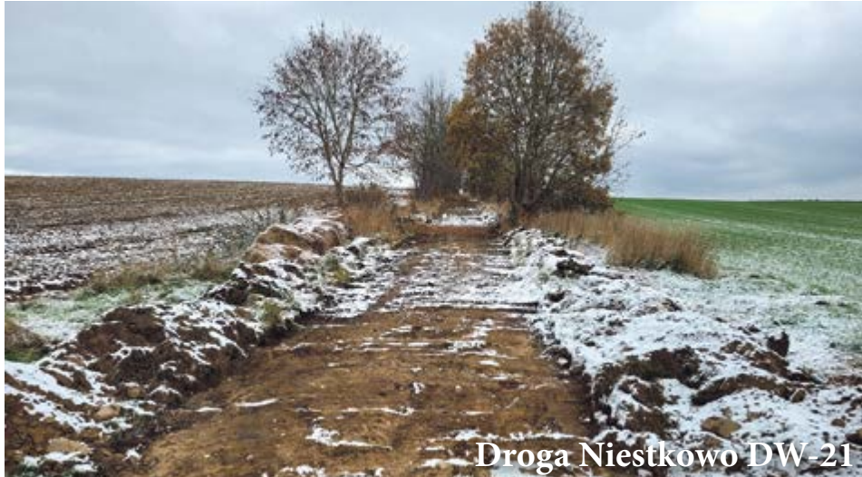
Droga Niestkowo DW-21