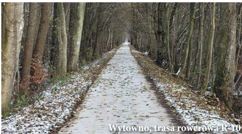
Wytowno, trasa rowerowa R-10

o łącznej powierzchni 168 metrów kwadratowych oraz dokonano miejscowych napraw na nawierzchniach z kostki betonowej oraz asfaltowych. Ułożono także kostkę betonową przy świetlicy wiejskiej w Gąbinie. Za niemal 17 tysięcy złotych prace wykonała firma Via ze Słupska.