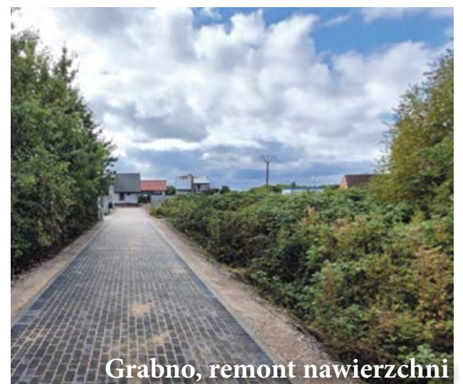
Grabno, remont nawierzchni