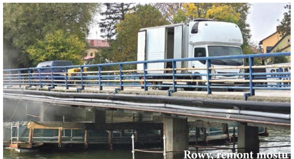
Rowy, remont mostu