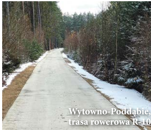
Wytowno-Poddąbie, trasa rowerowa R-10

i usunięciem kolizji z infrastrukturą energetyczną na Osiedlu Przewłoka. Inwestycja jest finansowana z dotacji budżetu państwa w ramach Funduszu Dróg Samorządowych w kwocie prawie 3,9 miliona złotych. Całkowita wartość inwestycji to 7,6 miliona złotych. Prace wykonuje firma Krężel z Kobylnicy. Powstaje tam nawierzchnia z kostki betonowej o powierzchni 16 tysięcy metrów kwadratowych, oświetlenie drogowe oraz kanalizacja deszczowa. Dofinansowanie z Funduszu Rozwoju Dróg wynosi 3,7 miliona złotych. Na ukończeniu jest przebudowa drogi gminnej Wytowno-Poddąbie w ramach Pomorskiej Trasy Rowerowej o znaczeniu międzynarodowym R10 i Wiślana Trasa Rowerowa R9 – Partnerstwo Gminy Ustka. Prace wykonuje firma Lorek ze Słupska. Wartość robót budowlanych wynosi dwa miliony złotych. W ramach inwestycji powstaje nawierzchnia betonowa o szerokości trzech metrów i długości niemal czterech kilometrów. Trwa remont mostu na rzece Łupawa w Rowach. Prace wykonuje firma Soroko z Koszalina. Planowany termin zakończenia prac to czerwiec przyszłego roku. Wartość remontu wynosi milion złotych. Za te pieniądze przeprowadzony zostanie remont elementów mostu oraz dojazdów. Przebudowywana jest również droga gminna w Wytownie w ramach Pomorskiej Trasy Rowerowej o znaczeniu międzynarodowym R10 i Wiślana Trasa Rowerowa R9 – Partnerstwo Gminy Ustka. Prace wykonuje firma Szymczak z Witkowa. Wartość inwestycji to prawie półtora miliona złotych. Powstaje tam nawierzchnia betonowa