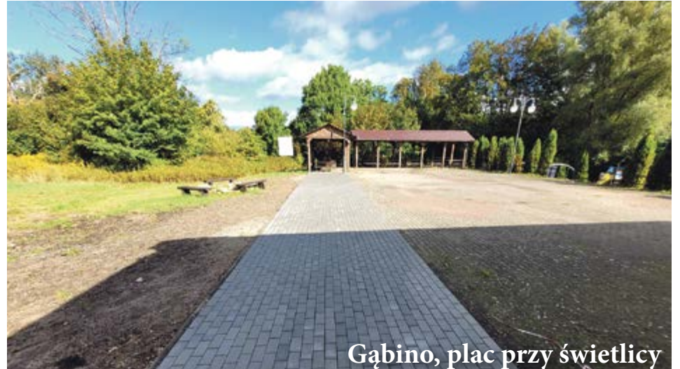
Gąbino, plac przy świetlicy

Na terenie całej gminy Ustka trwają remonty, modernizacje i przebudowy dróg. Łączna wartość wszystkich ukończonych właśnie lub wciąż realizowanych inwestycji przekracza 20 milionów złotych. Pieniądze w znakomitej większości pochodzą ze źródeł zewnętrznych.