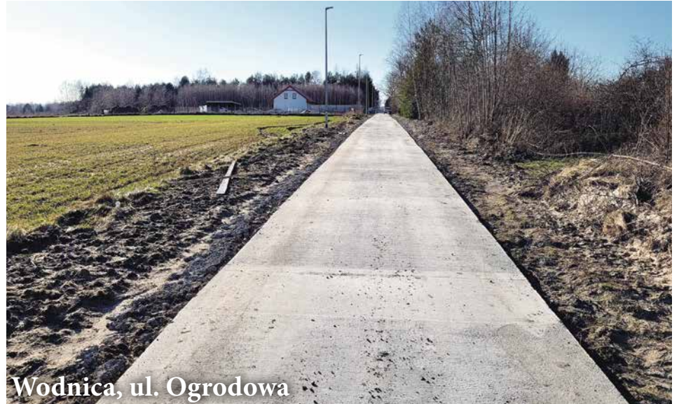
Wodnica, ul. Ogrodowa

drogi wojewódzkiej nr 203. Tam powstaną między innymi nowa nawierzchnia, chodniki, ścieżki rowerowe i kanalizacja deszczowa. Łączny koszt inwestycji wynosi prawie 5,3 miliona złotych. Zadanie jest dofinansowywane z Europejskiego Funduszu Rolnego na rzecz Rozwoju Obszarów Wiejskich w wysokości ponad 2,4 miliona złotych. Zakończyła się przebudowa drogi gminnej nr 101412G w Przewłocie w ramach zadania "Pomorskie Trasy Rowerowe o znaczeniu międzynarodowym R10 i Wiślana Trasa Rowerowa R9 - Partnerstwo Gminy Ustka". Wartość inwestycji to 106 tysięcy złotych. W ramach zadania powstało poszerzenie jezdni