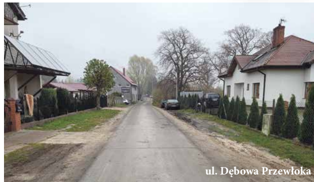
ul. Dębowa Przewłoka

Gotowy jest również ciąg pieszy w kierunku kościoła oraz dojście do boiska w Wytownie. Wartość prac to ponad 37 tysięcy złotych. Wykonała je firma Lorek ze Słupska. W ramach inwestycji powstała nawierzchnia z rozbiórkowej kostki betonowej na łącznej powierzchni 150 metrów kwadratowych.