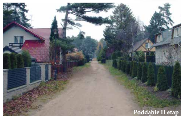
Poddąbie II etap