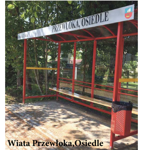
Wiata Przewłoka, Osiedle

Sytuacja epidemiczna nie zatrzymała drogowców. W wielu miejscowościach gminy bez przerwy realizowano większe i mniejsze inwestycje. Oto wykaz najważniejszych z nich.