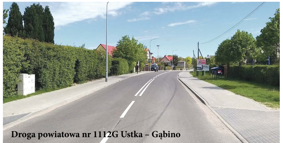
Droga powiatowa nr 1112G Ustka – Gąbino