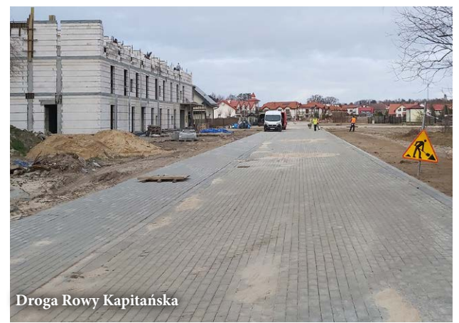
Droga Rowy Kapitańska

kierunku Wodnicy, od drogi powiatowej nr 1108G do drukarni. Rozstrzygnięcie konkursu nastąpi w połowie roku. W 2020 roku powstaną kolejne drogi betonowe. Obecnie trwa proces kompletowania dokumentów niezbędnych do uzyskania wszystkich zgód wymaganych prawem budowlanym oraz dokumentów do ogłoszenia przetargu. Opracowywane są między innymi mapy i dokumentacja kosztorysowa, o ile koronawirus nie zachwieje budżetem. Zrealizowane zostaną: