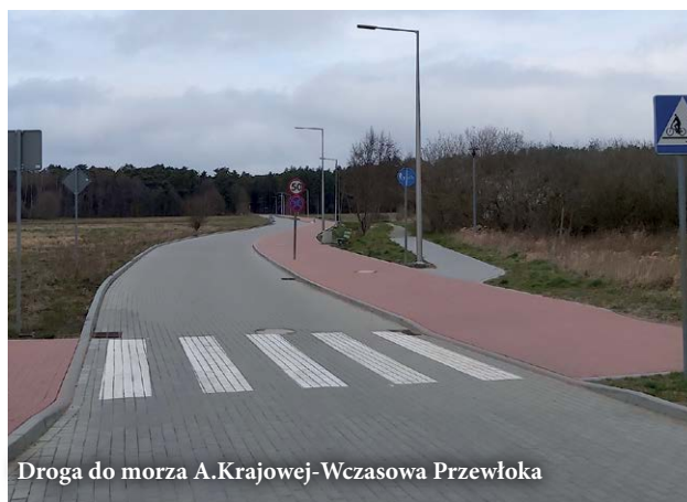
Droga do morza A.Krajowej-Wczasowa Przewłoka

W trakcie wyboru wykonawcy jest budowa dróg tymczasowych na osiedlu Przewłoka - kolejny proces scalenia i podziału. Na bieżący rok zaplanowano również opracowanie dokumentacji technicznej dla ulic: Długosza, Konarskiego, Konopnickiej, Dąbrowskiej, Prusa, Hłaski, Kasprowicza, Szymborskiej, Nałkowskiej, Lema, Orzeszkowej, Brzechwy, Herberta, Fredry. Długość łącznie tych ulic wynosi około 4,4 kilometra. Zakres przedmiotu zamówienia obejmuje: branżę drogową, branżę sanitarną (budowa kanalizacji