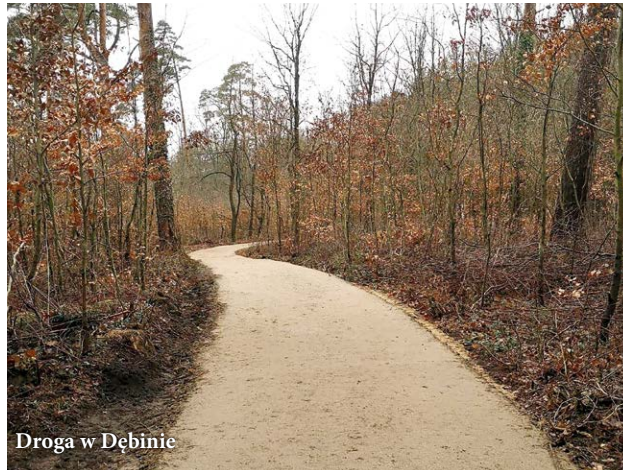
Droga w Dębiniu