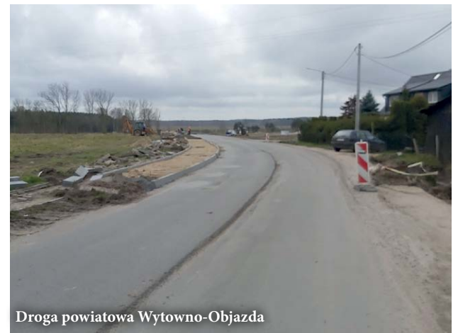
Droga powiatowa Wytowno-Objazda

W trakcie odbiorów technicznych jest budowa z kruszywa dojść do zejść na plażę i kładki w Dębiniu (1 ścieżka) i Poddąbiu (4 ścieżki). Prace wykonała firma Herkules z Krępy Słupskiej. Łączna wartość inwestycji realizowanej w formule zaprojektuj i wybuduj wynosi ponad 400 tysięcy złotych.