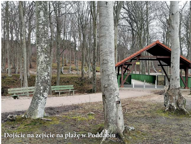
Dojście na zejście na plażę w Poddąbiu