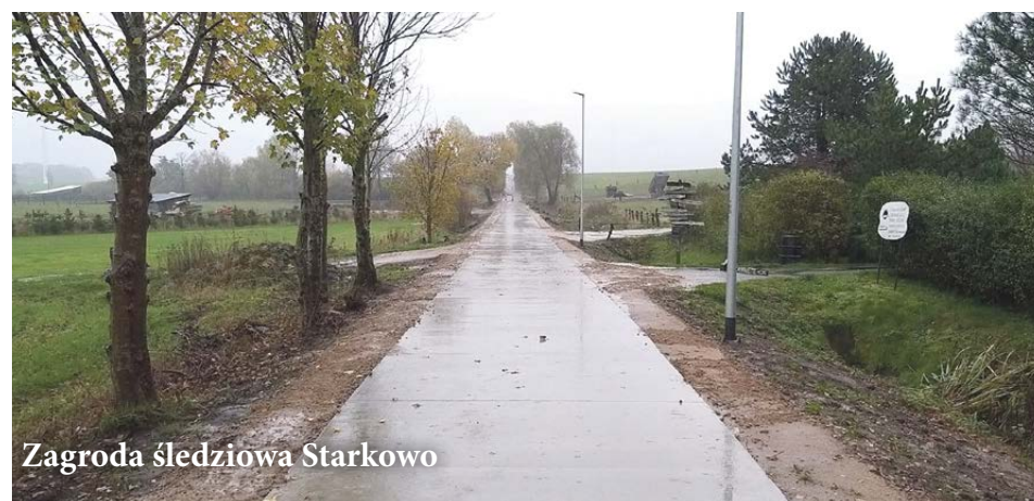
Zagroda śledziowa Starkowo

Firma Lorek ze Słupska kończy realizację kolejnych dróg betonowych (jezdnie o szerokości trzech metrów) w miejscowościach Możdżanowo (droga do posesji 8c o długości 200 m, za kwotę ok. 100 tysięcy złotych) i Wodnica (część ul. Ogrodowej i Wodnica Kolonia o łącznej długości 130 m, za kwotę prawie 60 tysięcy złotych). Ta sama firma jest na końcowym etapie