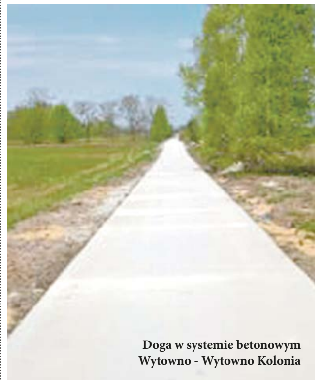
Doga w systemie betonowym Wytowno - Wytowno Kolonia

Na sierpniowej sesji Rady Gminy Ustka pojęto decyzję o zwiększeniu środków finansowych na realizację zadania pod nazwą „Przebudowa drogi powiatowej nr 1120G na odcinku Gąbino – granica gminy”. Pierwotnie zabezpieczona kwota w wysokości 900.000 zł (450.000 zł wynosiła pomoc finansowa gminy Ustka) nie pozwalała na sfinansowanie przebudowy. Niezbędne było zwiększenie pomocy finansowej gminy Ustka o 132.835 zł, do kwoty 582.835 zł (wartość zadania po przetargu wynosi 1.165.669,91 zł). To pozwoli zrealizować tę inwestycję jeszcze w tym roku.