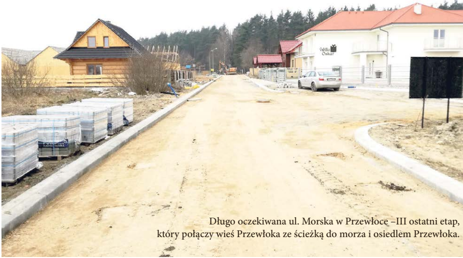
Długo oczekiwana ul. Morska w Przewłocę -III ostatni etap, który połączy wieś Przewłoka ze ścieżką do morza i osiedlem Przewłoka.

Wybrano już wykonawców na część zaplanowanych na ten rok dróg w technologii betonowej. W Dominku przy blokach, na odcinku o długości około 340 m i szerokości 4,5 m (3 m jezdni betonowa + 2 x 0,75 m pobocze z kruszywa) stara nawierzchnia brukowa zostanie zamieniona na beton.