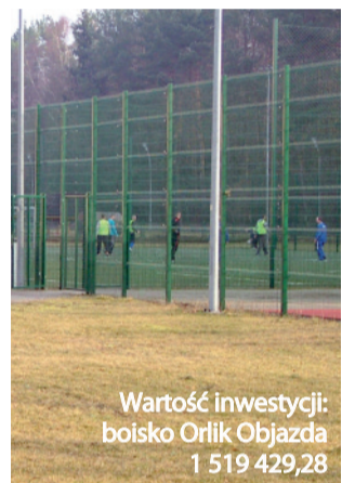
Wartość inwestycji: boisko Orlik Objazda 1 519 429,28