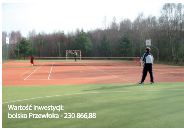
Wartość inwestycji: boisko Przewłoka - 230 866,88