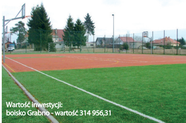
Wartość inwestycji: boisko Grabno - wartość 314 956,31

Dzieci i młodzież, którzy chcą rozpocząć profesjonalną karierę sportową, mogą zapisać się na zajęcia do klubów sportowych. Na terenie gminy jest ich aż pięć. Są to: Klub Sportowy Zaleskie, Gminny Klub Sportowy Wybrzeże Objazda, Stowarzyszenie Sportowe Klub Sportowy Słupia Charnowo, Stowarzyszenie Sportowe Klub Sportowy Bistral Machowino oraz Gminny Klub Piłkarski Karol Pęplino.