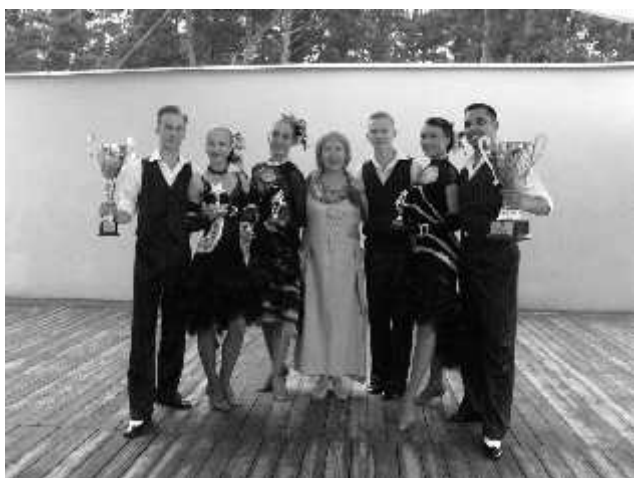
Zdobywcy Nagrody Wójta Gminy Ustka i Nagrody Publiczności w tegorocznym festiwalu

Lato rozpoczęło się w Rowach międzynarodowym przeglądem "Faworyci lata", w którym oczywiście nie zabrakło reprezentantów naszej Gminy