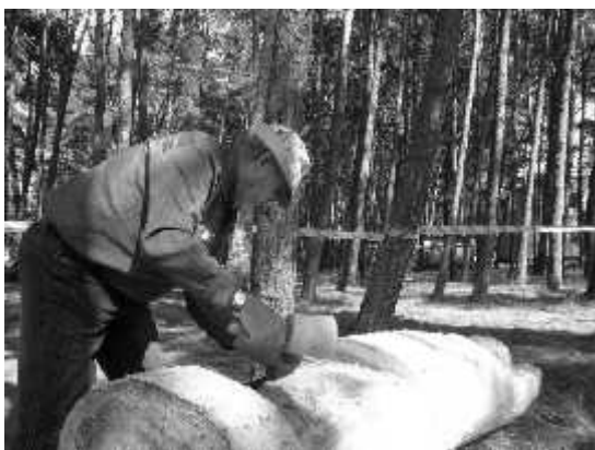
Józef Gawel w ubiegłym roku wyrzeźbił św. Piotra; w tym roku - św. Pawła. Obie figury stoją przy kościele