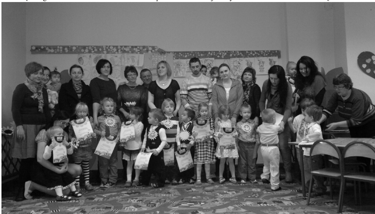
Przedшкоlaki wraz z rodzicami i zaproszonymi gośćmi w punkcie przedszkolnym w Duninowie podczas uroczystości pasowania na przedszkolaka

W świetlicach w Duninowie i Starkowie - w partnerstwie z Fundacją „Kaszubskie Słoneczniki” - zostały uruchomione punkty przedszkolne. Uczęszcza do nich około 30 dzieci przez 5 dni w tygodniu. Dzieci nie otrzymują posiłków, przynoszą ze sobą drugie śniadanie. Na uruchomienie punktów Fundacja uzyskała dofinansowanie zewnętrzne. Rodzice