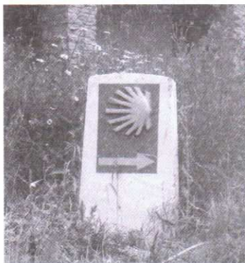
Droga św. Jakuba na całym świecie oznaczana jest stylizowaną muszlą zwaną muszlą św. Jakuba

Na terenie Gminy trwają prace, by powstał Szlak świętego Jakuba. Wyznacza on drogę do Hiszpanii, do katedry w Santiago de Compostella. To tutaj ma być pochowane ciało św. Jakuba Apostoła. Polsce powstają fragmenty Szlaku prowadzące przez inne miejsca pielgrzymie, kapliczki przydrożne, lokalne sanktuaria czy trasę małych wiejskich kościołów. Gmina Ustka w koncepcji powstania łącznika do głównego Szlaku, prowadzącego przez Duninowo, chce zachęcić turystów do odwiedzania naszej ziemi. Wpisując się w tradycję tras pielgrzymkowych, chce promować się również ten sposób. Nasze zabytki sakralne są równie cenne z historycznego punktu widzenia jak wielkie katedry. Zaś nasze krajobrazy i malownicze tereny w niejednym mogą wzbudzić zachwyt dla otaczającego piękna. Stąd pomysł, by wesprzeć powstający Szlak świętego Jakuba. Może się on przyczynić do powstania jeszcze jednej gałęzi turystyki, jaką jest turystyka pielgrzymkowa.