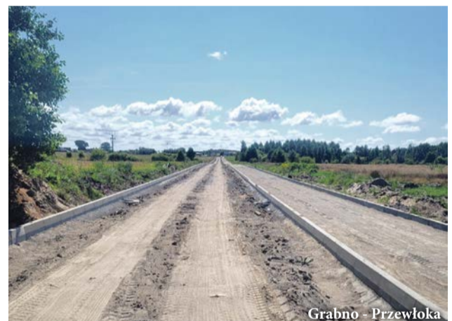
Grabno - Przewłoka