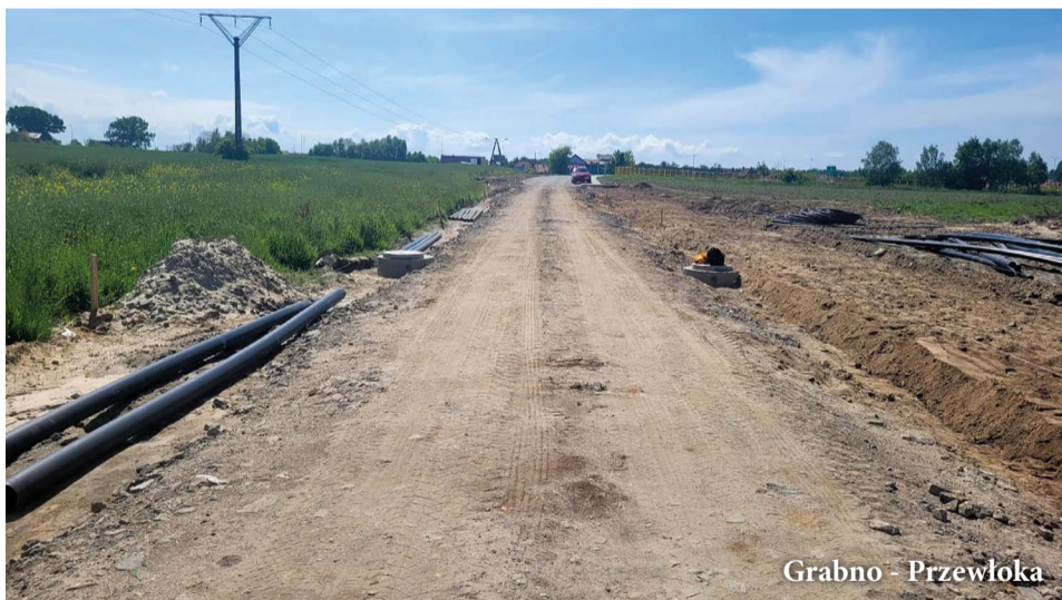
Grabno - Przewłoka