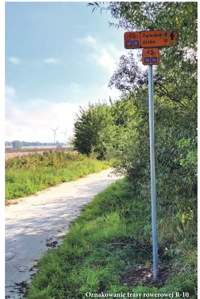
Oznakowanie trasy rowerowej R-10