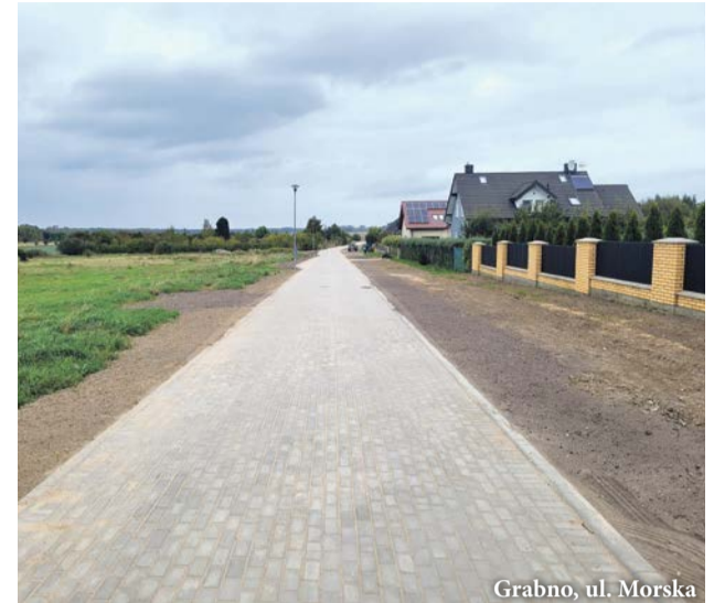
Grabno, ul. Morska