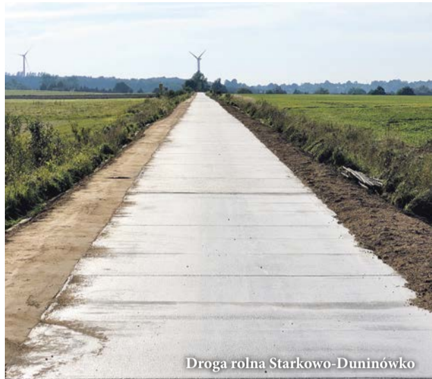
Droga rolną Starkowo-Duninówko

W ostatnich tygodniach na kilku drogach na terenie gminy Ustka zakończyły się prace modernizacyjne. Kierowcy już mogą korzystać z wyremontowanych odcinków dróg.