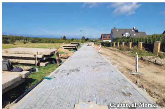
Grabno, ul. Morska