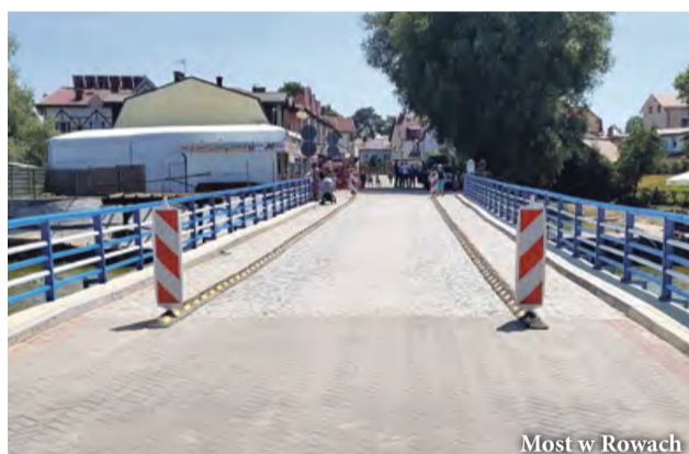
Most w Rowach

Firma K2 z Rybnika realizuje oznakowanie Pomorskiej Trasy Rowerowej o znaczeniu międzynarodowym R-10 i Wiślanej Trasy Rowerowej R-9 Partnerstwo Gminy Ustka. Prace realizowane są na odcinku od Zaleskich do Objazdy (od granicy z Gminą Postomino do granicy z Gminą Smołdzino). Oznakowanie gotowe będzie we wrześniu, a wartość prac wynosi ponad 78 tysięcy złotych.